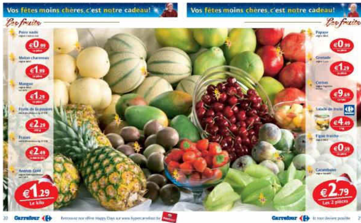
Figure 2 : Une salade de fruits réalisée exclusivement avec les fruits frais en promotion proposés par Carrefour.

papayes, figues et melons charentais du Brésil, de fruits de la passion de Colombie, de grenades des Etats-Unis, de fraises d'Israël, d'ananas du Costa Rica, de cerises d'Argentine et de caramboles de Malaisie. Elle décide d'y ajouter deux kiwis de Nouvelle-Zélande, une orange d'Afrique du Sud et une pomme belge pour que tous les continents soient représentés dans le même récipient. Evidemment, alors que nous approchons de Noël et que, comme en 2006 et 2007, il fait toujours 10°C dehors et que nos jeunes bambins s'inquiètent à l'idée de ne pas avoir matière à faire une seule boule de neige, un tel dessert a un coût : une distance cumulée de 126 000 kilomètres (Figure 3) et une facture approximative de 9 kg de CO 2 émis, en prenant en compte les modes de transport. Là-dessus, nous déboucherons une bouteille de mousseux blanc de Tasmanie, une île au sud de l'Australie (20000 km, B, 0,3 kg de CO 2 ).