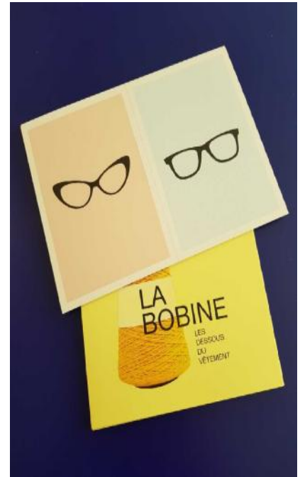
Le jeu de la Bobine