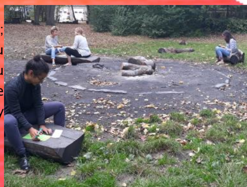
Week-end de clotûre PI – septembre 2019