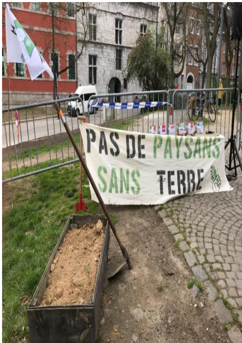
Action lors de la journée internationale des luttes paysannes 2019