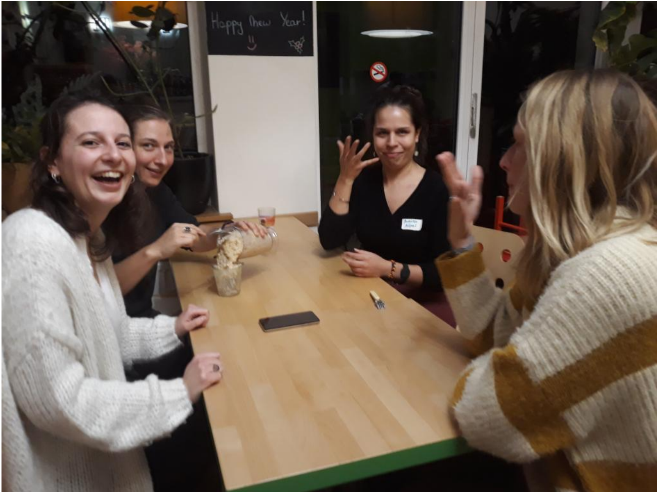
Apéro. Ancien-ne-s et nouveaux-elles responsables – janvier 2019