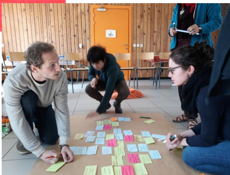
Formation volontaires 2019