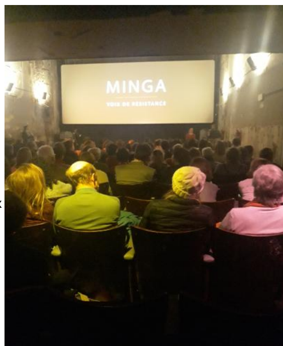
Première de Minga, cinéma Nova – février 2019

Le film a été diffusé 48 fois en 2019. De nombreux centres culturels l'ont programmé. Il a été vu en Belgique francophone, mais aussi en Flandres (7 fois) ainsi qu'en France, en Suisse, au Québec et en Colombie. Plusieurs dates sont prévues en 2020 également.