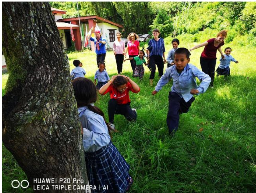
Projet au Népal avec le CWIN - août 2019