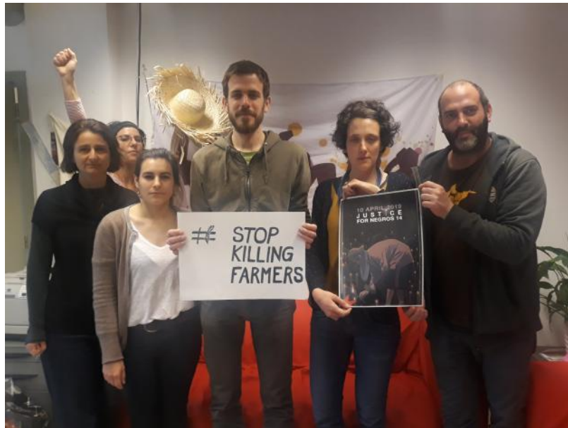
Soutien aux agriculteurs de Negros, Philippines – mars 2019