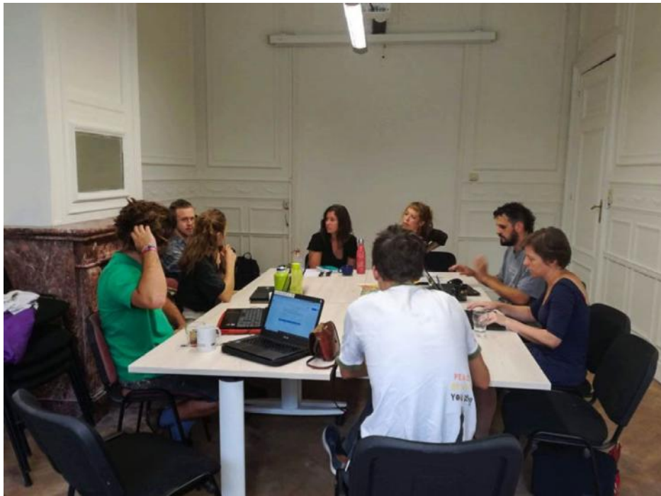
Journée d'accompagnement du collectif Mozaïk – septembre 2019

Parmi les accompagnements, ont eu lieu : une formation à la désobéissance civile pour Act for Climate Justice, un accompagnement d'AIA aux outils d'intelligence collective, un soutien à la création et diffusion de documentaire « Commune Utopie » pour Collectif Mozaïk.