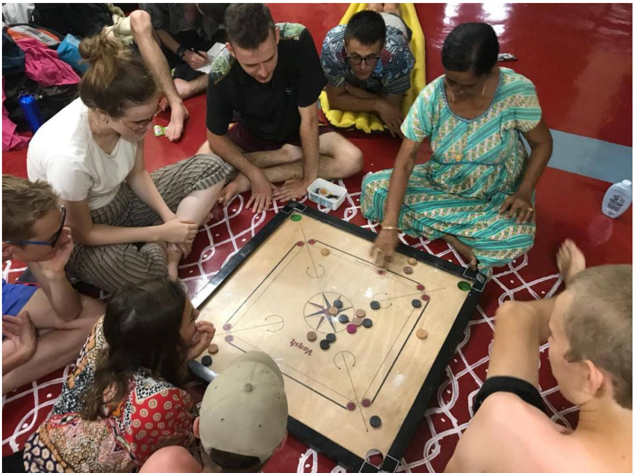
Projet international en Inde – juillet 2019