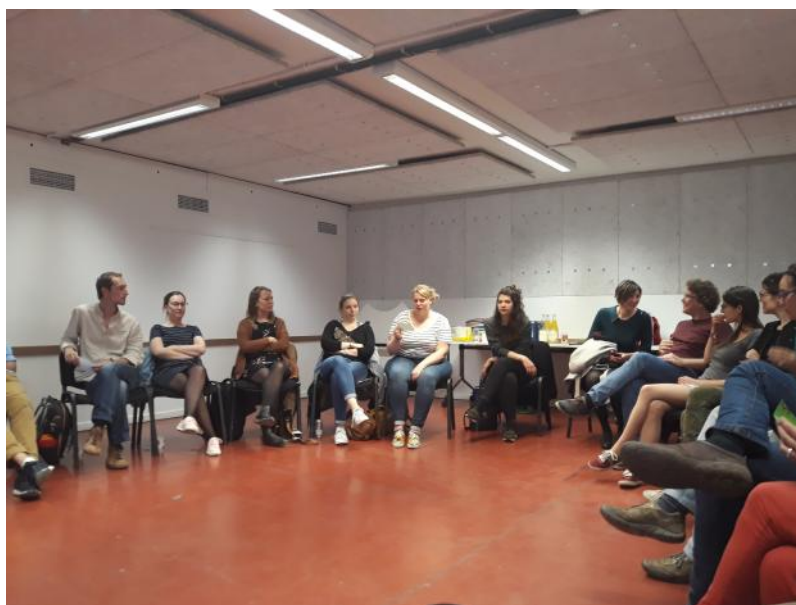
Assemblée générale - mai 2019

En 2019, l'AG comptait 52 membres, dont 39 femmes (soit 75%).