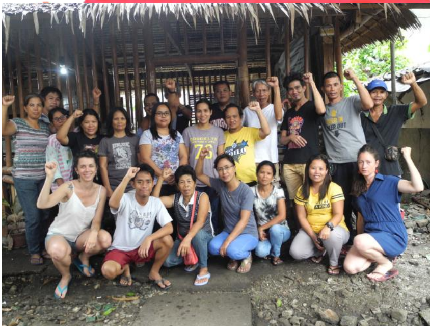
Mission aux Philippines – juin 2019