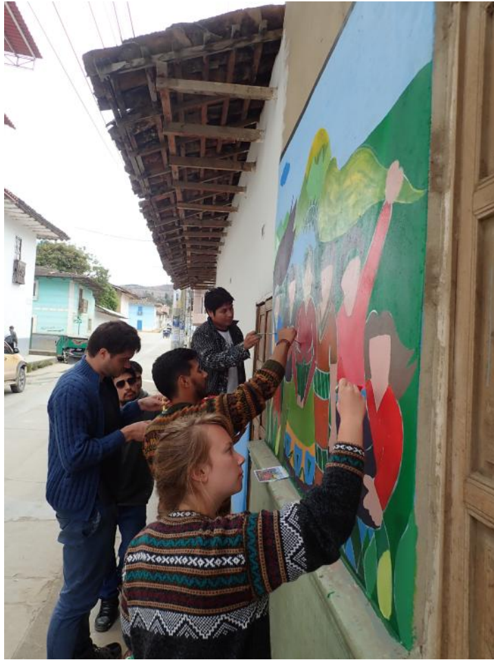
Premier projet au Pérou avec GRUFIDES - juillet 2019