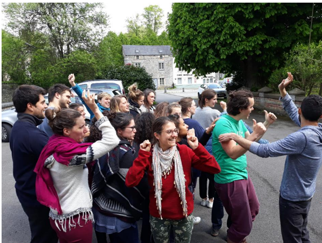
Formation responsables – mai 2019