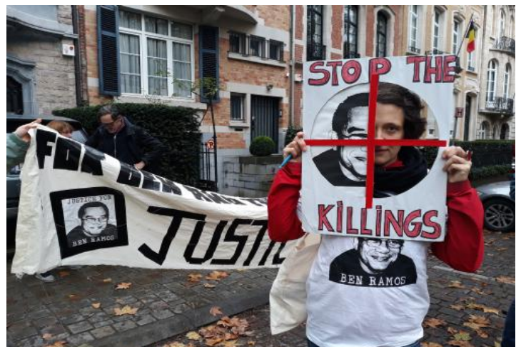
Action Justice for Ben – novembre 2019