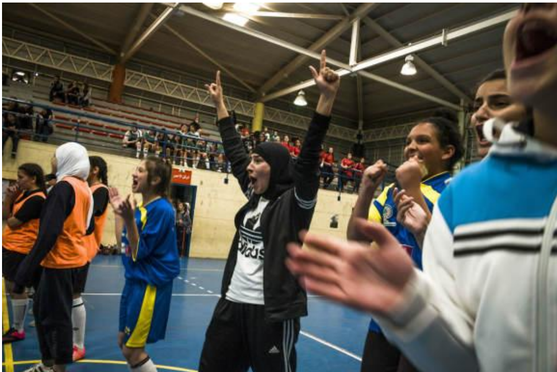
Un des visuels de l'outil 'What the foot', réalisé par le collectif HUMA et soutenu par Quinoa