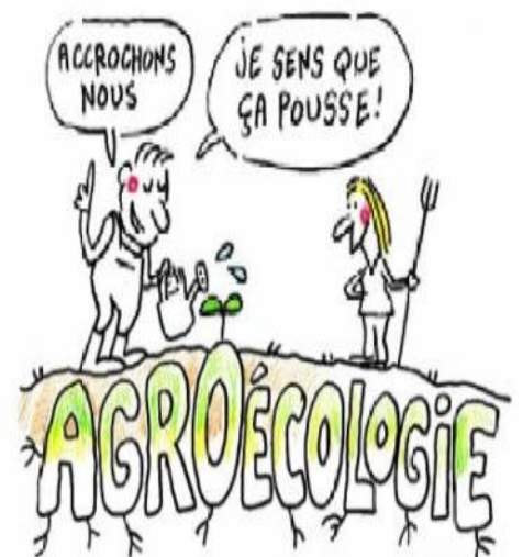
Petit hommage à Yakana, l'auteur de cette illustration, disparu récemment