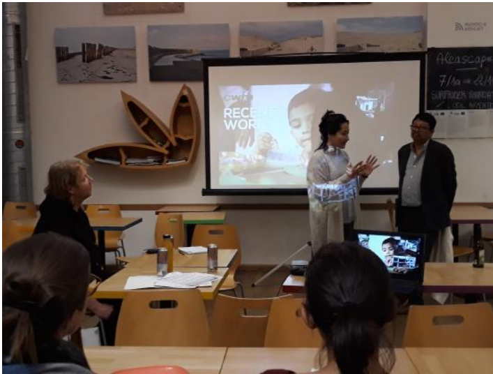
Rencontre publique avec le CWIN – octobre 2019