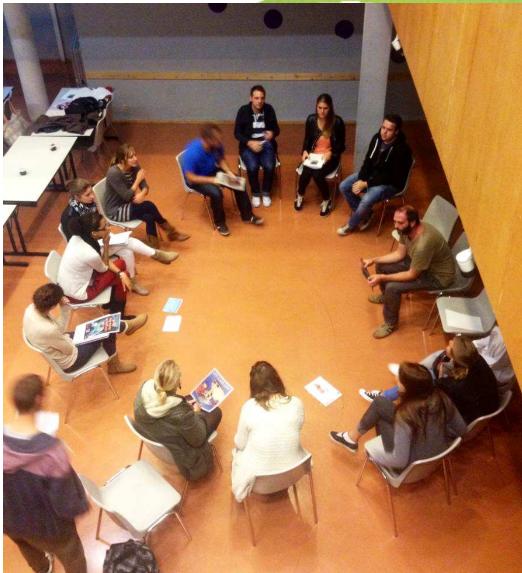
ANIMATION a l'isalt - OCTOBRE 2014

89% des jeunes font le lien entre les réalités locales et les enjeux globaux ET entre leurs réalités et les enjeux du système monde de manière au moins satisfaisante.