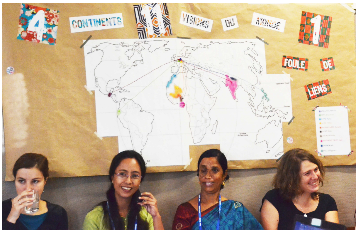
ACCUEIL PARTENAIRES - OCTOBRE 2014