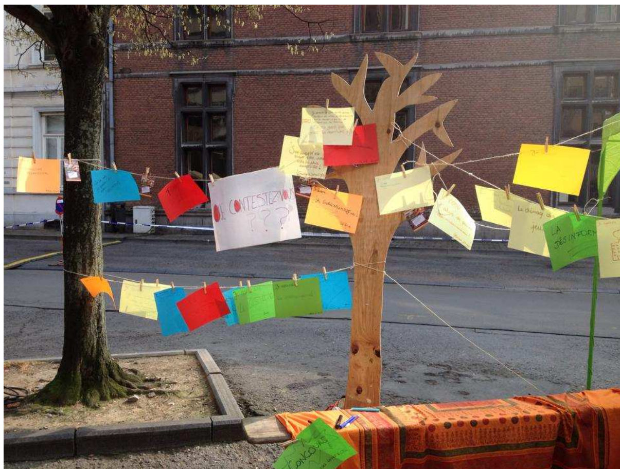
ANIMATION PORTEURS DE PAROLE QUE CONTESTEZ - VOUS ? - avril 2014