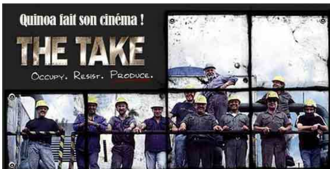
AFFICHE CINE-DEBAT - SEPTEMBRE 2014