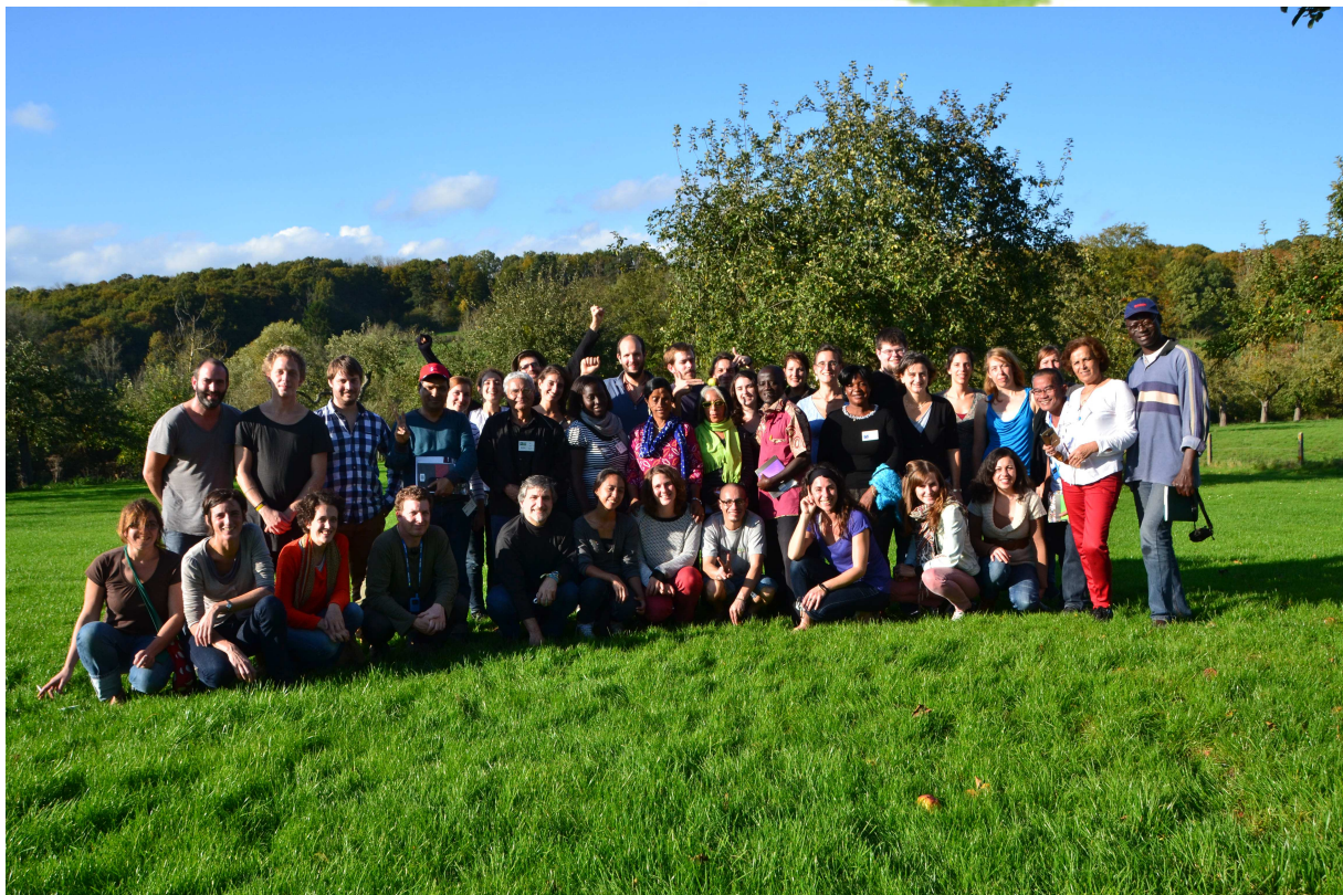
ACCUEIL PARTENAIRES - OCTOBRE 2014

http://www.quinoa.be/wp-content/uploads/2015/04/ACCUEIL%20PARTENAIRES.pdf