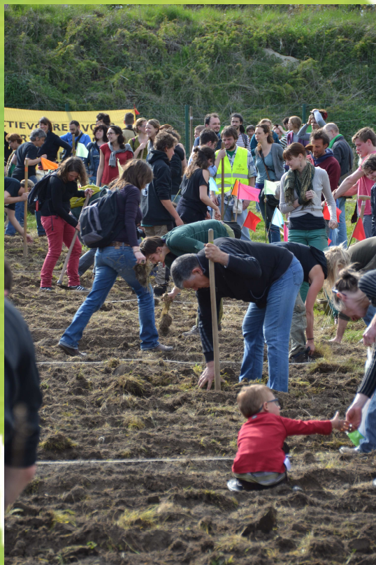
JOURNÉE D'ACTION DES LUTTES PAYSANNES A HAREN - avril 2014