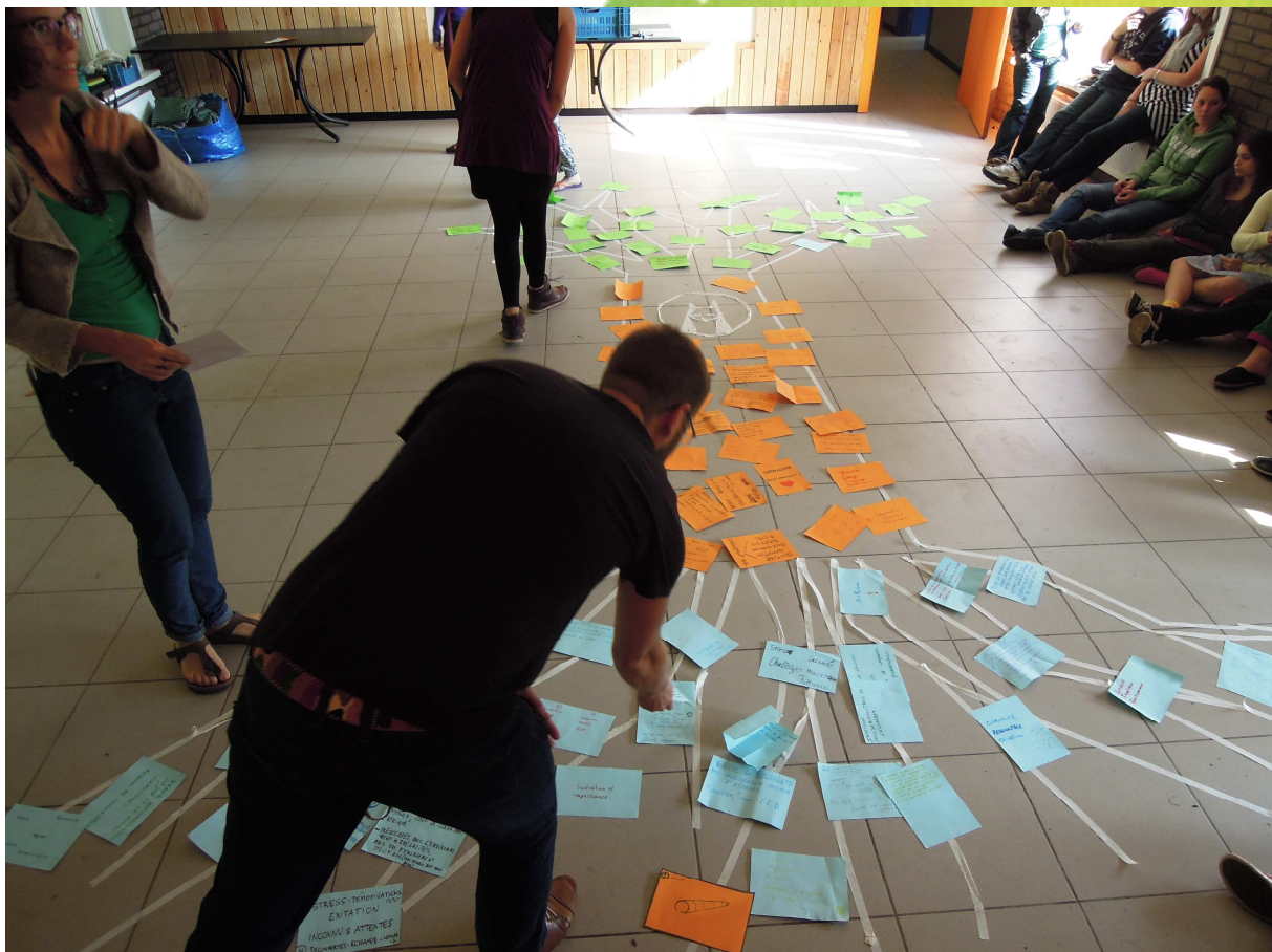
FORMATION RESPONSABLES PROJETS INTERNATONAUX - avril 2014