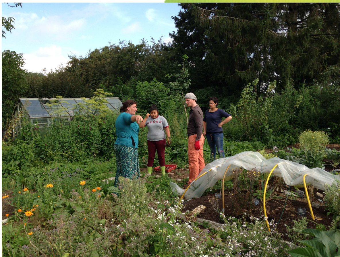
FERME CENS'EQUIVOQUE - AOUT 2014