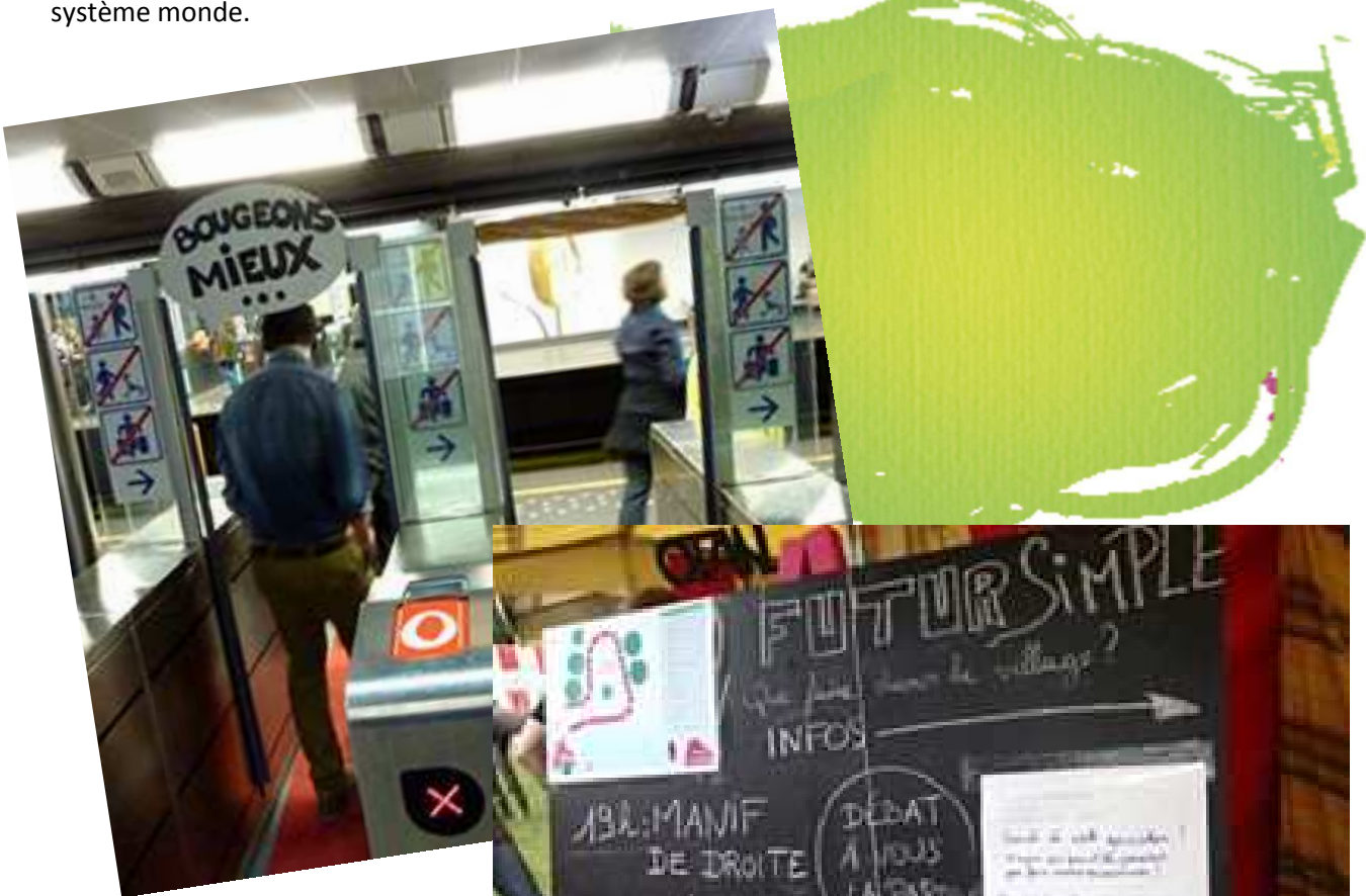
FORUM DES DESOBEISSANCES - OCTOBRE 2014

86 % du public a acquis de nouvelles connaissances critiques et/ou valorisantes sur les enjeux du système monde.